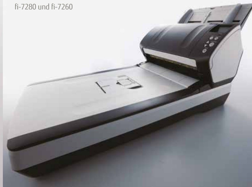
fi-7280 und fi-7260

Trägerfolien Trägerfolien ermöglichen das Scannen von Dokumenten größer als A4, oder von Fotos und empfindlichem Beleggut. {Artikelnummer – PA03360-0013}